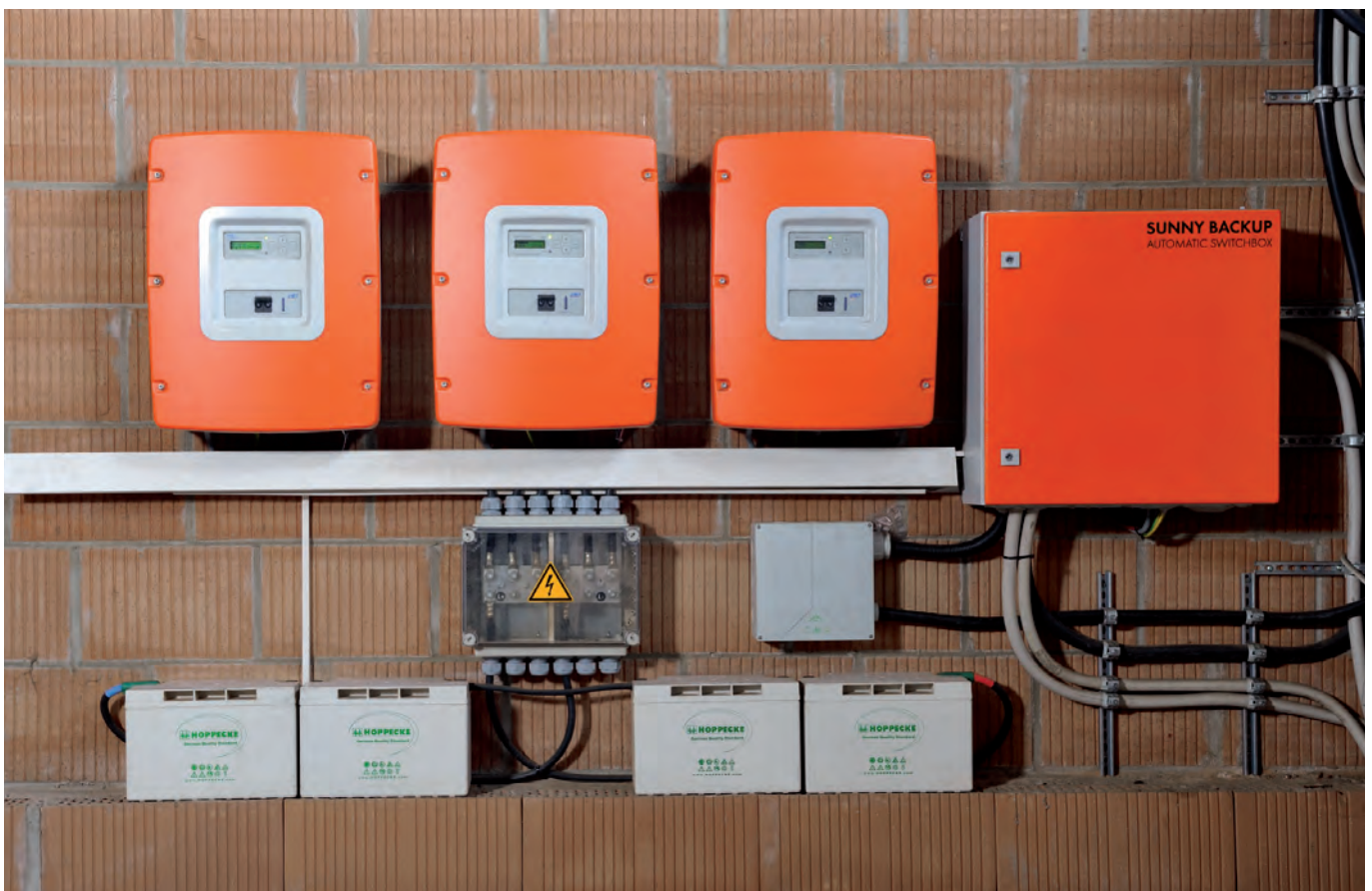
Abb. 3: Hightech für maximalen Eigenverbrauch – das Sunny Backup-System von SMA

Mittelfristig wird aber auch die Zwischenspeicherung von PV-Energie mit Batteriesystemen attraktiv. Denn wer in der Lage ist, den Verbrauchszeitpunkt des PV-Stroms beliebig zu wählen, kann die Eigenverbrauchsquote noch einmal deutlich steigern. Mit den Sunny Backup Sets von SMA ist hierfür bereits eine ausgereifte technische Lösung verfügbar, ganz abgesehen von der eigentlichen Funktion der ausfallsicheren Energieversorgung. Die Kosten der zusätzlichen Batteriezyklen von rund 20 ct pro kWh sorgen zwar momentan noch dafür, dass der Einsatz von Backup-Systemen zur Steigerung des Eigenverbrauchs unwirtschaftlich ist. Bei künftig niedrigeren Batteriekosten lässt sich aber nahezu jede Solar-Anlage auch nachträglich mit einem Sunny Backup-Set ergänzen, sofern sie mit PV-Wechselrichtern von SMA ausgestattet ist.